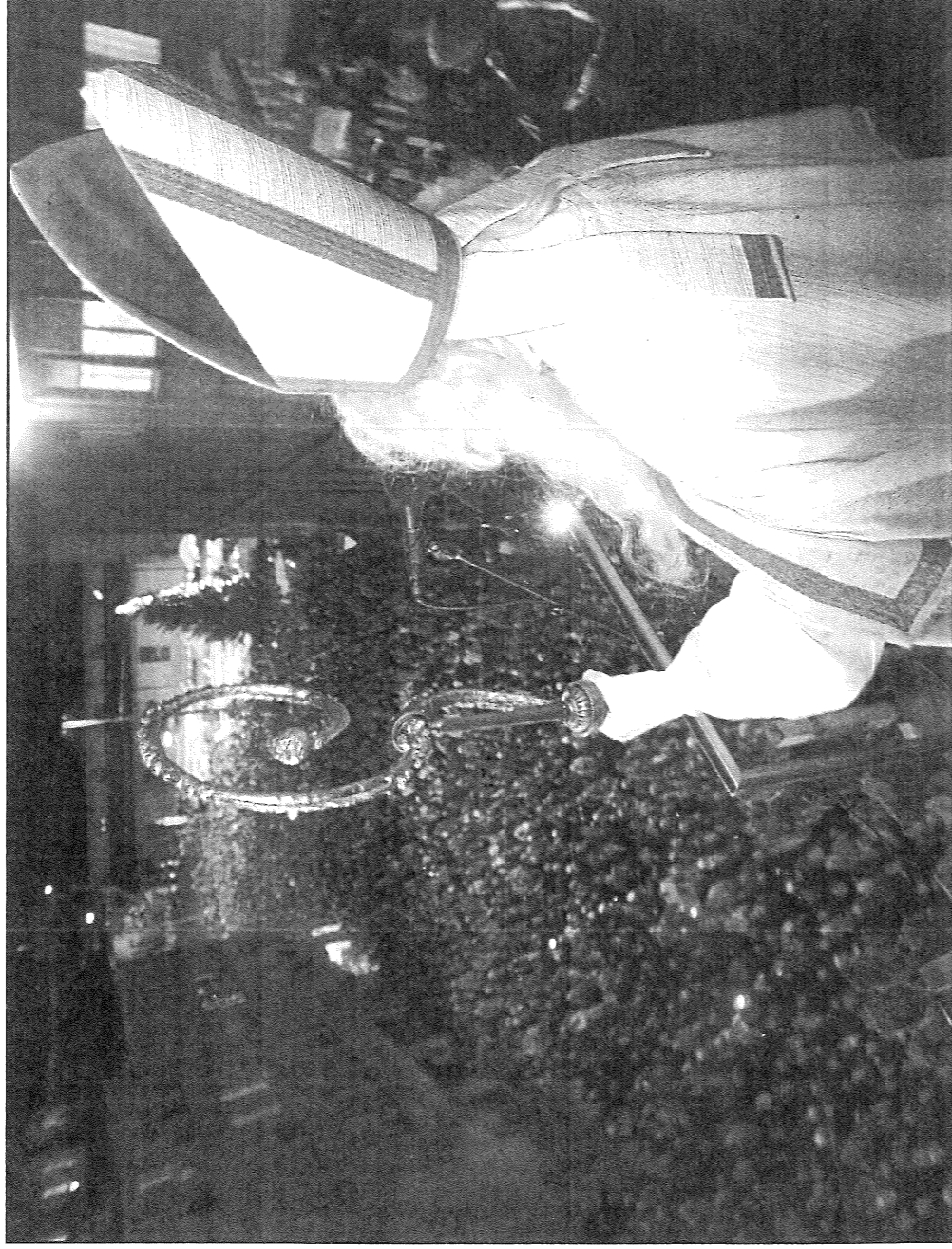
Le traditionnel discours de Saint-Nicolas restera, malgré tout, le point culminant de la soirée. CHARLY RAPPO-À

FRIBOURG • De nombreuses animations, dont un parcours ludique imaginé par Hubert Audriaz, seront organisées pour la Saint-Nicolas le 3 décembre.