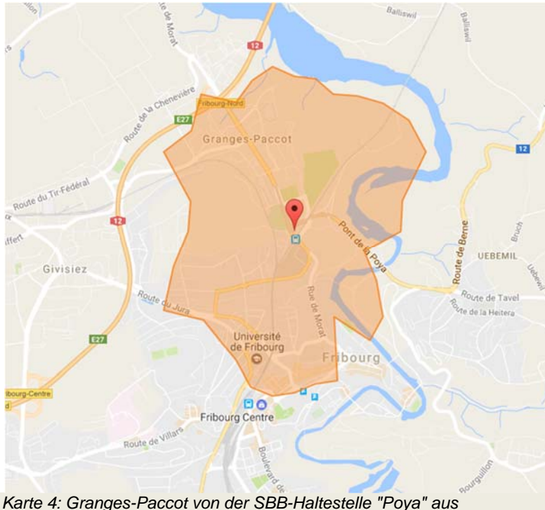
Karte 4: Granges-Paccot von der SBB-Haltestelle "Poya" aus

Die folgende Karte 4 zeigt, dass das Forum Freiburg von der SBB-Haltestelle „Poya“ aus in weniger als 20 Minuten erreichbar ist.