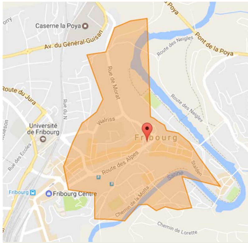
Karte 2: In weniger als 10 Minuten von der TPF-Haltestelle „Tilleul“ aus zu Fuss erreichbare Standorte

Aus der folgenden Karte 2 ist ersichtlich, dass man von der TPF-Haltestelle « Tilleul » aus das Stadtzentrum und die Fussgängerzone der Romontgasse in weniger als 10 Minuten zu Fuss erreichen kann.