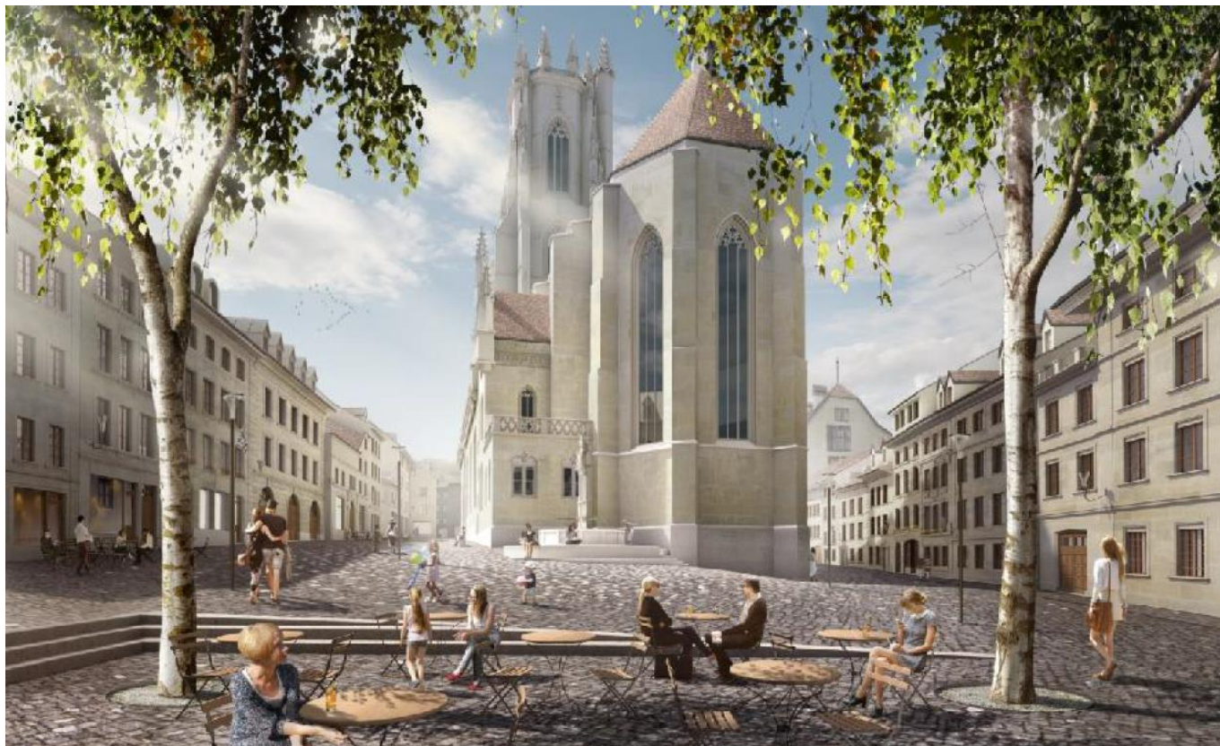
Figure 4 : vue de la place Sainte-Catherine (à titre illustratif)

Les arrêts de bus actuellement situés sur les rues du Pont-Suspendu et des Chanoines sont déplacés sur la tête du pont de Zähringen, matérialisant la porte d'entrée du site. Ce déplacement permet de créer une interface TP / MD notamment de par la proximité avec les escaliers du Pont de Zähringen.