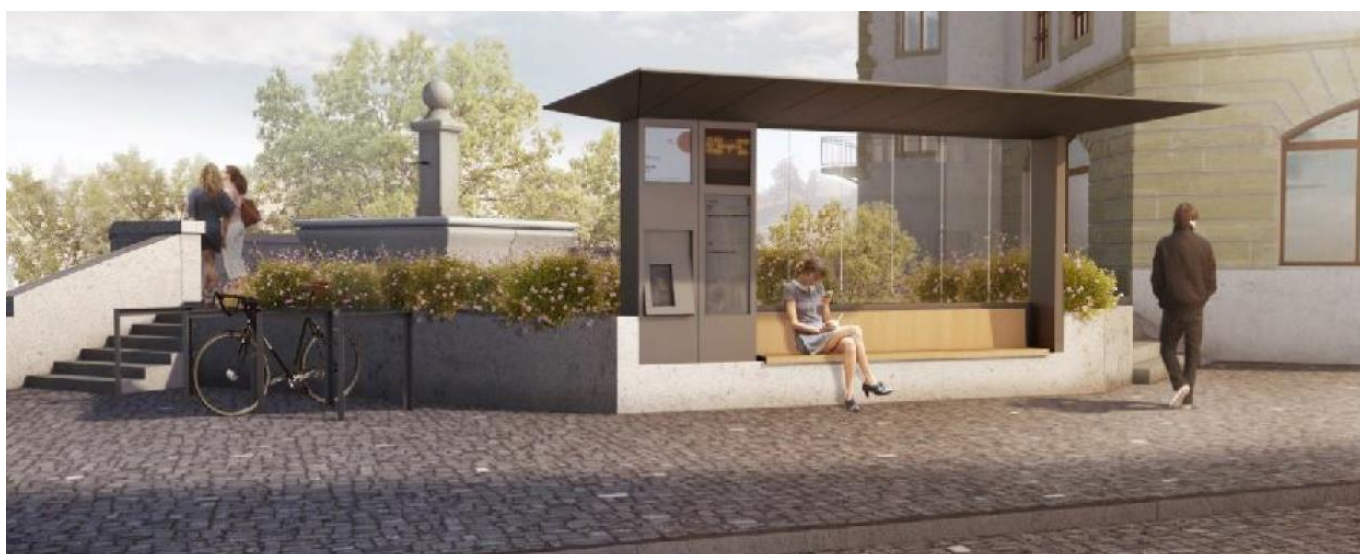
Figure 5 : tête de pont côté Bourg (à titre illustratif)

Les arrêts de bus actuellement situés sur les rues du Pont-Suspendu et des Chanoines sont déplacés sur la tête du pont de Zähringen, matérialisant la porte d'entrée du site. Ce déplacement permet de créer une interface TP / MD notamment de par la proximité avec les escaliers du Pont de Zähringen.