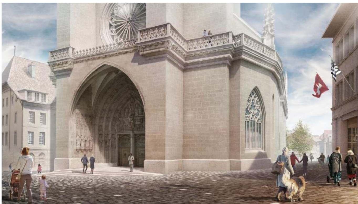
Figure 3 : entrée de la Cathédrale (à titre illustratif)

L'espace est pavé de façade à façade. La circulation des bus et des vélos est canalisée sur la chaussée de la rue des Chanoines, délimitée par un chanfrein perceptible pour les malvoyants et franchissable pour les personnes à mobilité réduite. Le solde de l'espace est réattribué aux piétons.