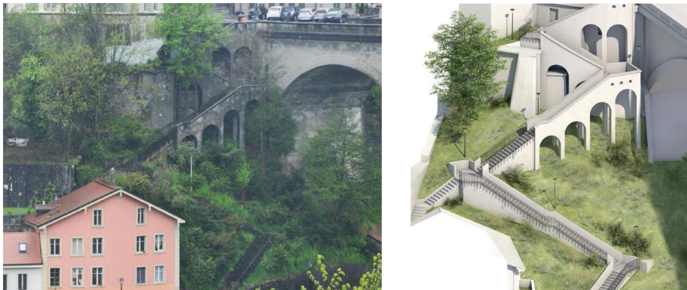
Figure 6 : état actuel des escaliers et projet de restauration

Ce projet ambitieux, visant à redonner un véritable statut de centralité au Bourg, nécessite le déplacement 50 places de stationnement existants actuellement dans le périmètre du projet. Celles-ci seront relocalisées sur les chaussées avoisinantes à savoir : 19 sur la route de Berne, 6 sur la route du Bourguillon, 7 places route François-Arsent, 11 places sur le parking de la Tour rouge et 7 places sur la parcelle n°4244. Seule la création des 11 places sur le parking de la Tour rouge occasionnera des frais significatifs qui entreront dans le calcul de la subvention de l'Agglomération, les autres places de stationnement pouvant être réalisées en marquage par les services de la Ville de Fribourg.