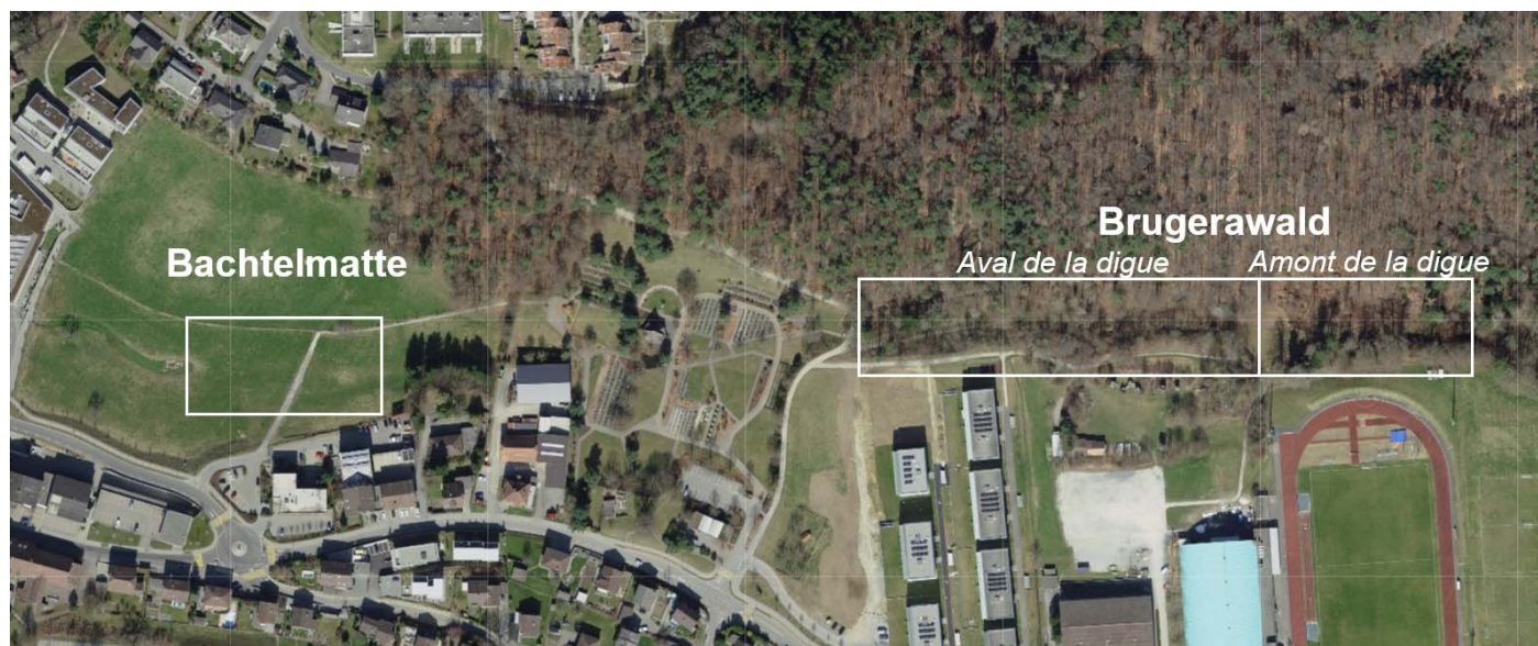
Plan de situation : les tronçons du Heitiwilbach remis à ciel ouvert dans le cadre de ce projet

De manière générale, le projet de revitalisation permet une protection contre les dangers liés à l'eau, d'améliorer la qualité du paysage et la biodiversité.