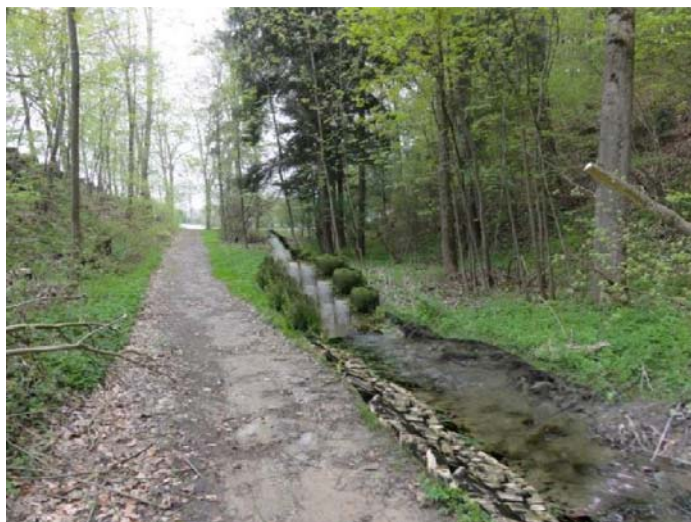
Photomontage du secteur en amont du cimetière