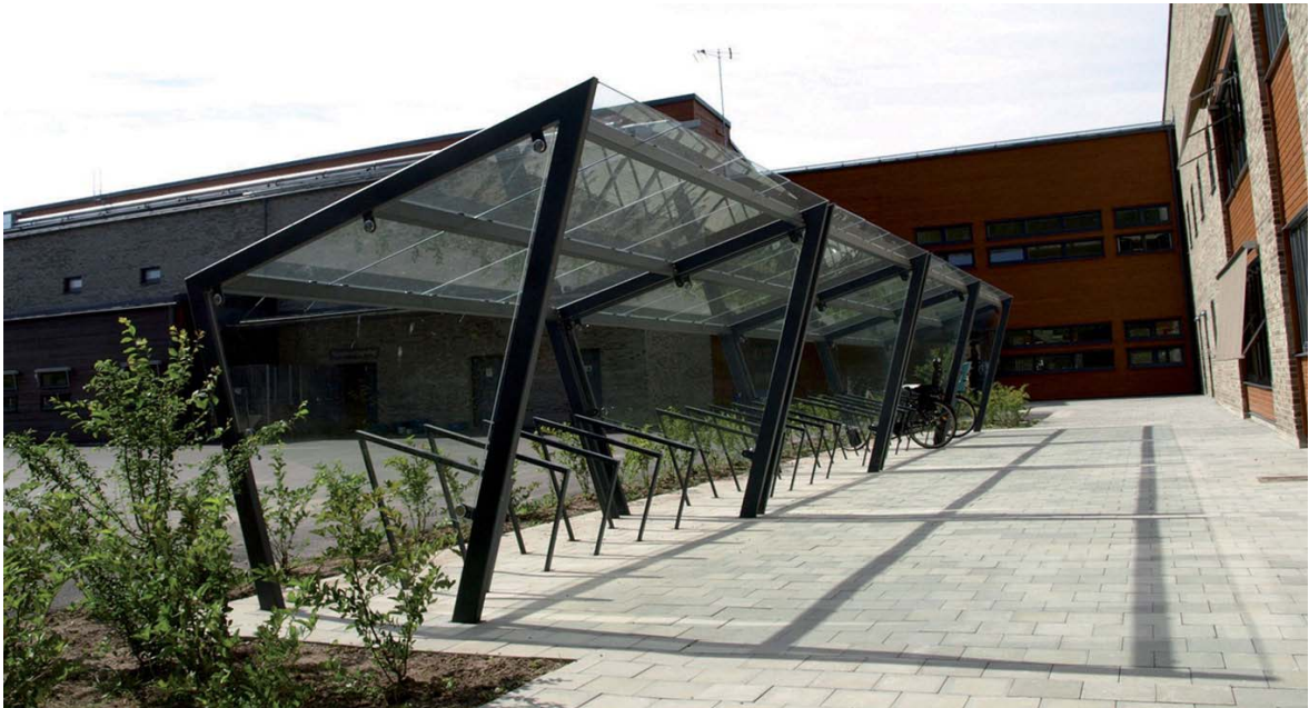
Figure 1 : visualisation de l'abri-vélos projeté de type « Edge »