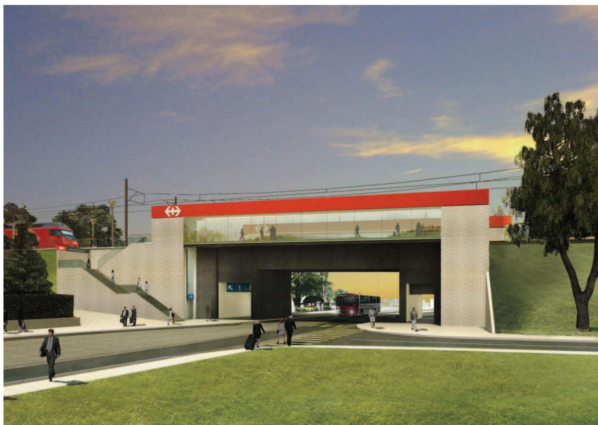
Image de synthèse de la future halte CFF de St-Léonard

(source : CFF, 2010, présentation « Fribourg St-Léonard – Nouvelle halte ferroviaire »)